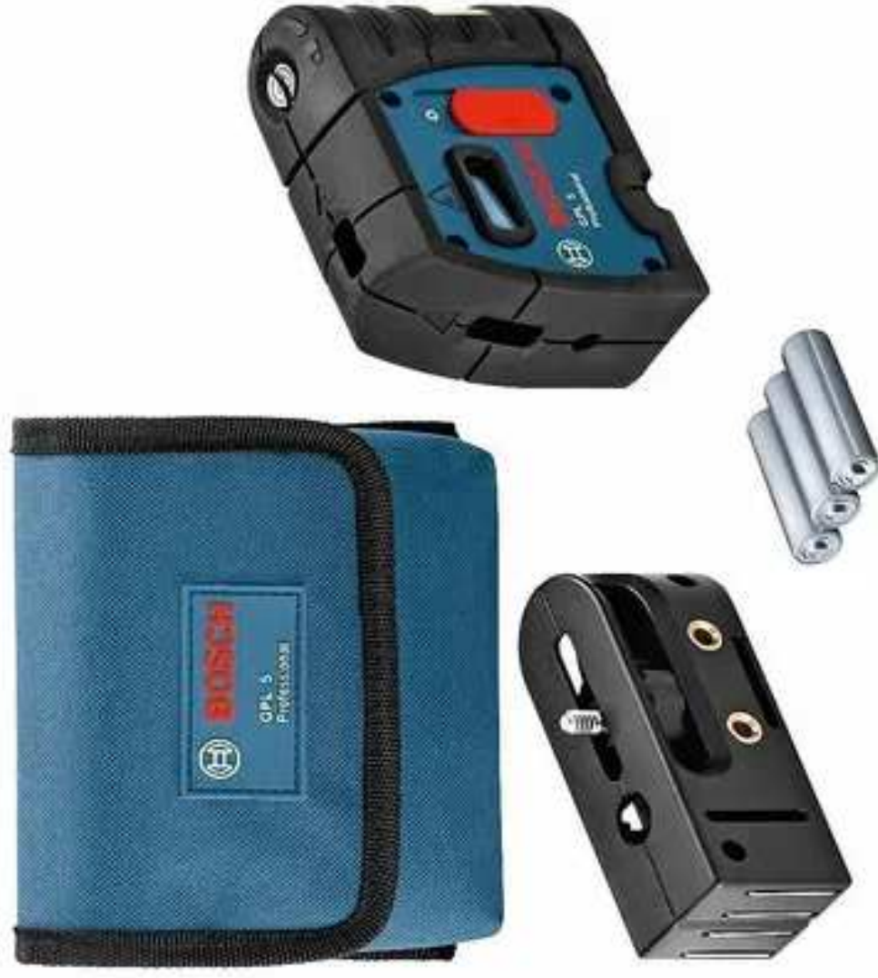
Imágen ilustrativa de Nivel Láser Bosch Autonomizante Puntos 30 Mts Plomada Gpl 5